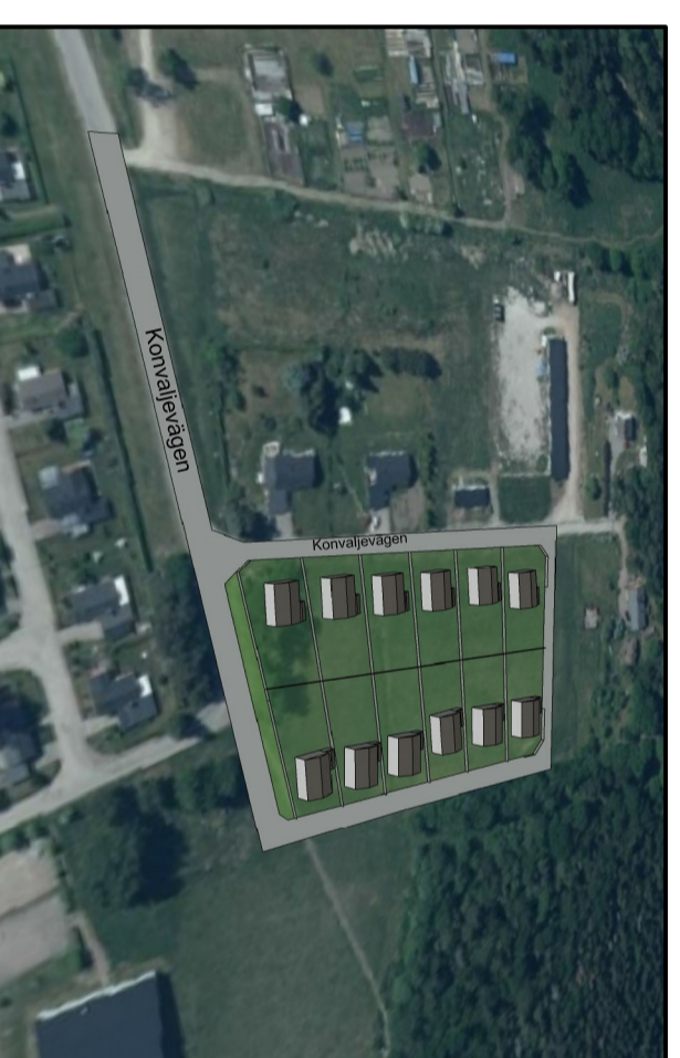
Visar möjlig utformning av området.