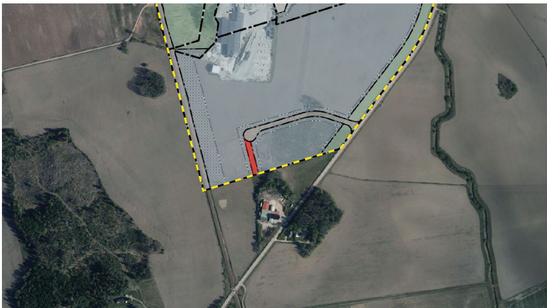
Karta 1. Gällande planområde för Stadsplan 81 Eriksberg inom gulstreckad markering. Föreslaget område att upphävas är rödmarkerat.

Den del av stadsplanen som föreslås upphävas ligger inom fastighet Eriksberg 2:1 som ägs av kommunen och utgör en kil mellan två skiften i en privatägd fastighet som delar fastigheten. På fastigheten pågår exploatering. Området som föreslås upphävas är cirka 1200 kvadratmeter stort.